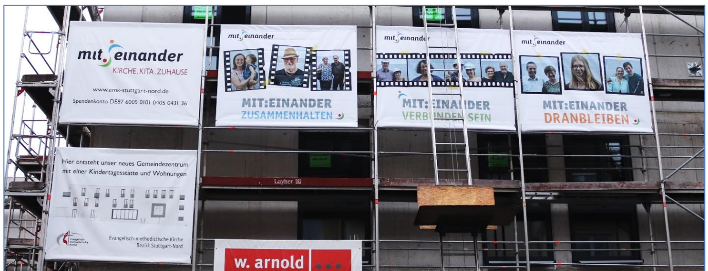
Die neuen Banner am Gerüst in der Burgenlandstraße zeigen, was uns als Gemeinden wichtig ist: miteinander zusammenhalten – verbunden sein – dranbleiben.

Online shoppen fürs mit:einander : www.bildungsspender.de/miteinander-emk